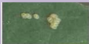
16- تخم های بید کلم

۳- مبارزه شیمیایی با سموم ذیل زمانی که جمعیت آفت در تله ها وارد نرم مبارزه گردد.. (نرم مبارزه را کارشناسان مستقر در مزرعه و مدیریت حفظ نباتات استان تعیین می نمایند.)