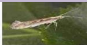
15- حشره کامل کلم