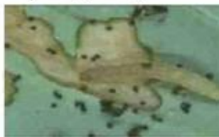
17- لارو بید کلم